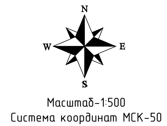
Схема границ для соглашения об установлении сервитута на кадастровом плане территории в отношении части земельного участка с КН 50:25:0040107:170, в целях размещения объекта электроснабжения согласно ТУ № В8-22-302-42354(935631)